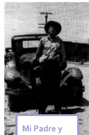
Mi Padre y su Model A

A limited series now streaming on Netflix