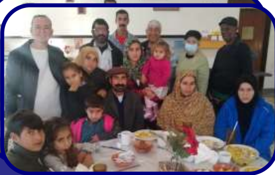
Familia Afgana con 9 hijos, los padres y voluntarios

Como parte de nuestro programa de Hospitalidad Franciscana, recibimos a varios hombres afganos solteros y familias afganas que estaban esperando una vivienda para establecerse en el área. Fue un desafío porque la mayoría no hablaba inglés, y ninguno de nosotros hablaba su idioma, generalmente pashto o dari. Tenemos una idea de lo difícil que debe ser para