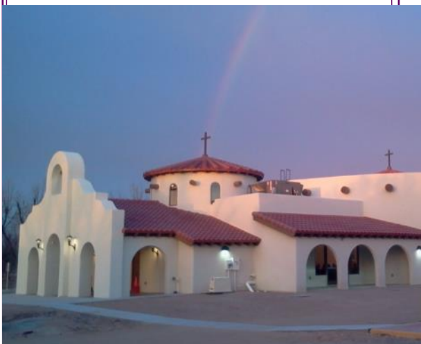
Capilla de Holy Cross Retreat

"Quédate quieto y sabe que yo soy Dios".